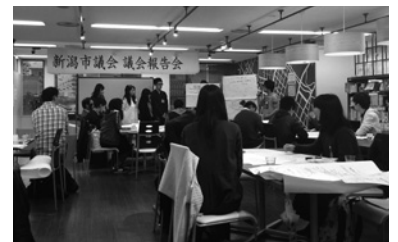
話題の中心は若者の雇用確保でした

私は中央区担当となり、新潟国際情報大学の学生と「人口減少」をテーマに話し合いました。